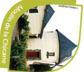
Moulin de la Chicane